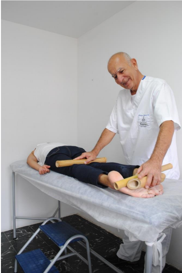
BAMBUTERAPIA MASAJES CON CAÑAS DE BAMBÚ